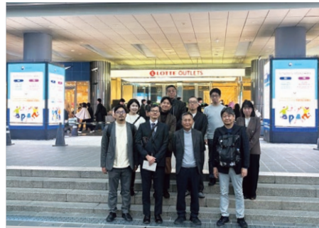
ソウル駅(新駅)で集合写真