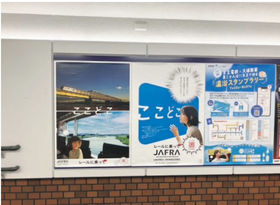
京王電鉄・下北沢駅