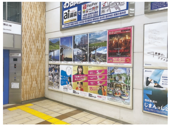
西武鉄道・石神井公園駅

「ここどこ」レールに乗って、車窓を眺めているとまるで映画化アニメの主人公になったよう