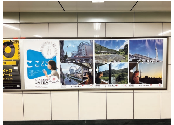
東京メトロ・新宿三丁目駅

（企画の詳細は、JAFRA NEWS vol.89 4月号に掲載 https://j-jafra.jp/wp-content/uploads/2025/07/JAFRANEWS_89.pdf ）