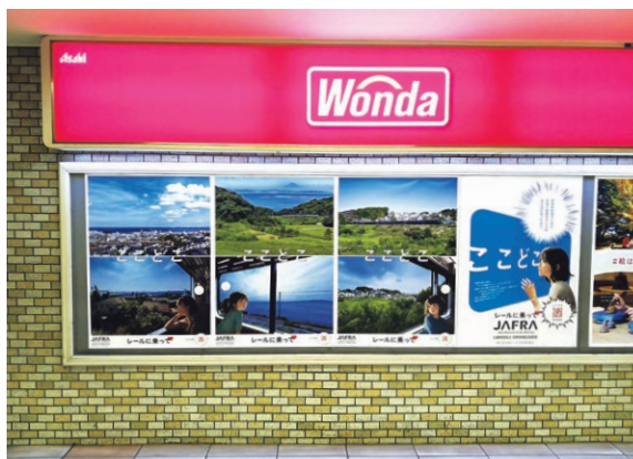
相模鉄道・横浜駅