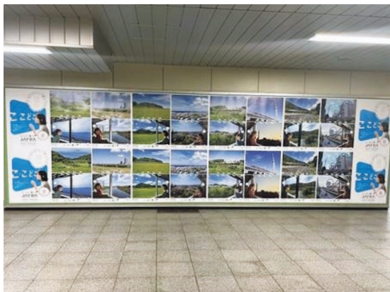
東日本旅客鉄道・新橋駅