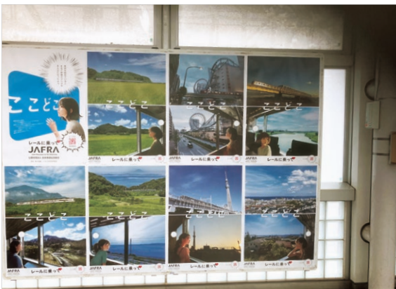
京成電鉄・日暮里駅