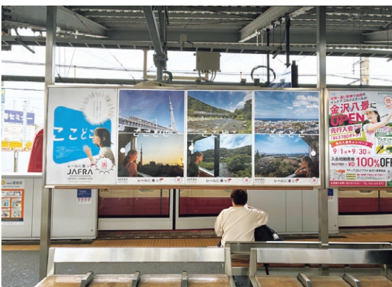
京急電鉄・金沢文庫駅