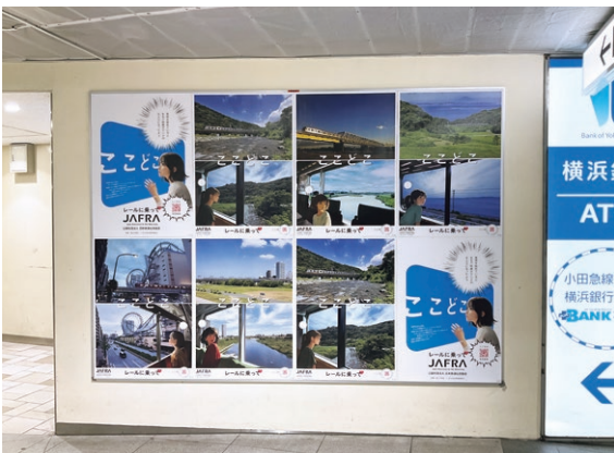
小田急電鉄・新宿駅

今回の企画を成功させるにあたり、あらためて多くの方々にご理解とご協力をいただいたことに心から感謝いたします。これからも、鉄道利用の魅力をアピールすることで利用促進を図り、ひいては鉄道広告の活性化のためにも、当該鉄道のみならず、横断的に一体となつて他社のポスターを相互に掲出し、広く首都圏の鉄道ネットワークを認識していただくよう努めてまいります。