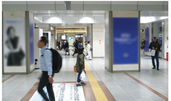
サイネージとのタイアップ

さらにデジタルサイネージは機能的 にはデータドリブン型マーケティング とも親和性が高く、規制緩和や運用に よっては今後さらなる広告効果の最大 化が期待できます。駅周辺の来訪者属 性や動線データなどを活用することで、 特定の時間帯やターゲット層に向けた 広告配信が可能です。たとえば、平日 の通勤時間帯にはビジネス関連のサー ビス広告、休日や祝日には観光情報や 地域イベントの告知を行うといった時