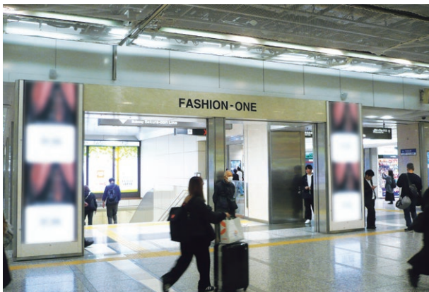
名古屋駅ツインビジョン桜通口