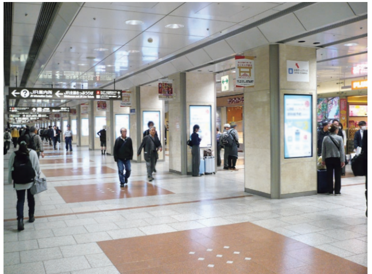
シリーズ・アド・ビジョン名古屋

シリーズ・アド・ビジョン名古屋に代表される連続型のサイネージは、構内を移動する人々にも漏らさず情報を供給することができます。しかもデジタルフラッグなど一部を除き目線の高さに設置されているため、QRコードなどの利用も容易です。 近年はAIやデータ解析技術の進化により、デジタルサイネージ広告はさらに高度化する可能性を持っています。運用にあたりクリアすべき問題はありますが、技術的には視認者数や属性の計測、滞留時間の分析などを通じて、広告内容をリアルタイムで最適化することも可能となり、より精度の高いターゲット広告が実現できる可能性があります。