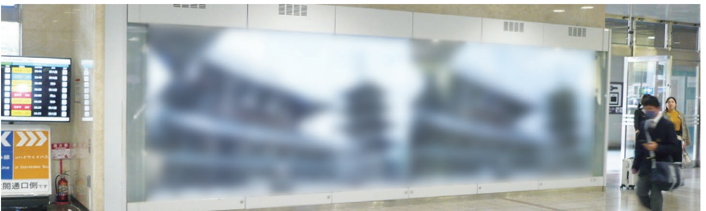
名古屋エクスプレスビジョン

JR名古屋駅を中心とする交通拠点 との連携は、デジタルサイネージ活用 の大きなポイントです。駅構内の大型 スクリーンは、通勤・通学者だけにな く観光客や出張者にも情報を届けるこ とができ、地域と全国、さらに海外へ の発信力を持っています。