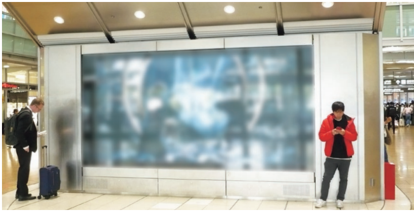
名古屋デジタルスクエア

性の高いものが多く、特に名古屋駅の 全国展開のプロモーションを展開する 際に利用しやすいものとなっています。 その一方で周辺駅などは、ソースとし て地域密着型の施策を主とするものも 多く見られ、地元店舗や季節のイベン トなど告知など棲み分けがなされてお り、それらは利用者に親近感を与える だけでなく、地域ブランドの認知拡大 にも利用されています。