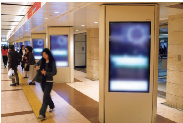
J・AD ビジョン central 名古屋駅地下通路