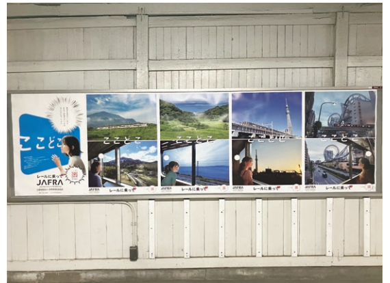
東急電鉄・武蔵新田駅