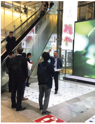
博多駅でサイネージの説明を受ける

広島駅では、完成された路面電車のホームを見学し、JR西日本コミュニケーションズ様による説明を受けました。JRや商業施設からのアクセスが好評であることや、工事完成に伴い、媒体も時流に合わせて変化させている旨の説明を受け、現在、工事中の札幌駅へ情報提供をしていきたいと感じました。