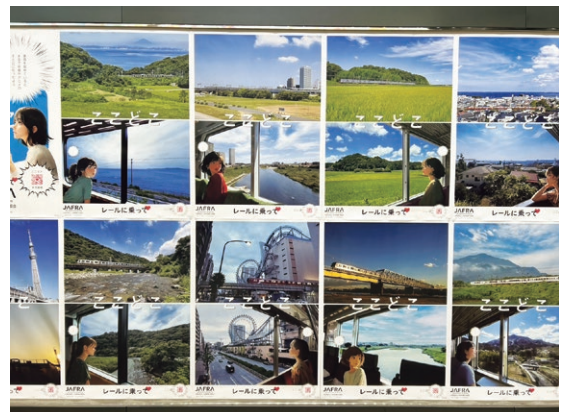
東武鉄道・川越駅