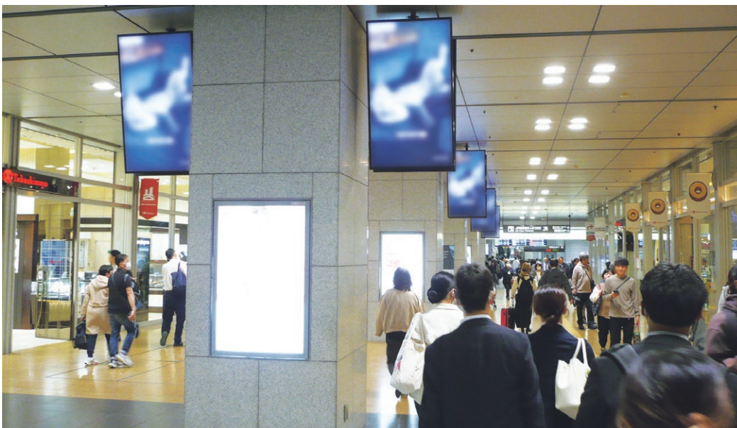
名古屋駅桜橋口デジタルフラッグ

名古屋市内各駅の主要な場所に設置されているデジタルサイネージは、設置の態様・規格とも汎用